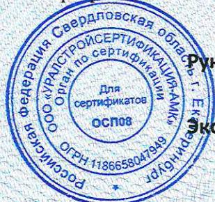
Схема сертификации 4с